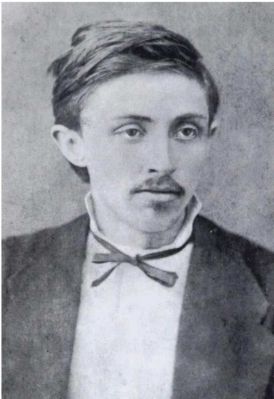
Дмитрий Мамин-Сибиряк – выдающийся писатель-прозаик, драматург, автор