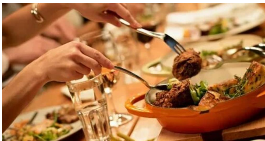
Русский метод: гости сами раскладывают себе еду в тарелку