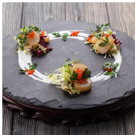
подача на сланцевой тарелке