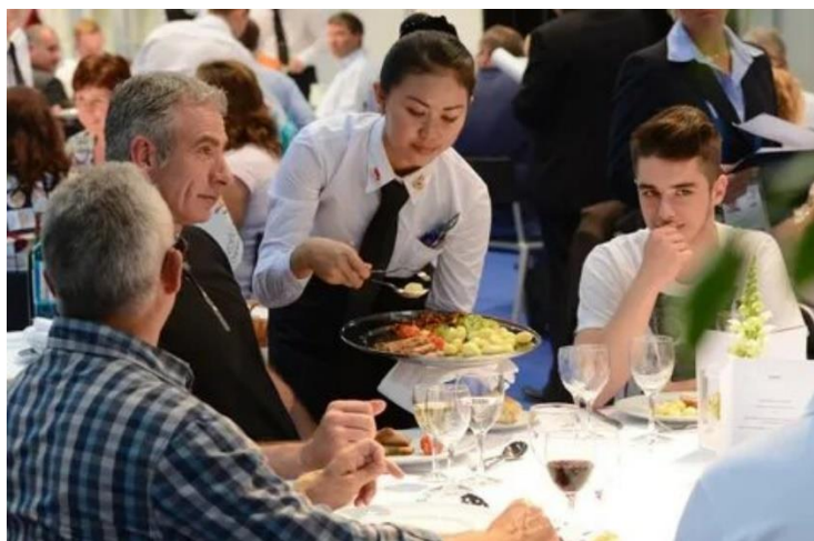
Французский метод: официант перекладывает еду перед гостем