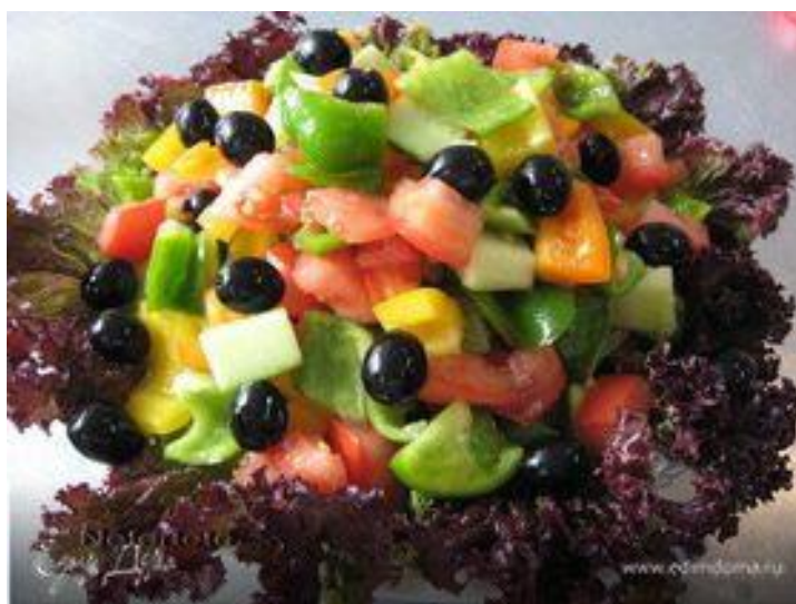
Греческий салат в лаваше