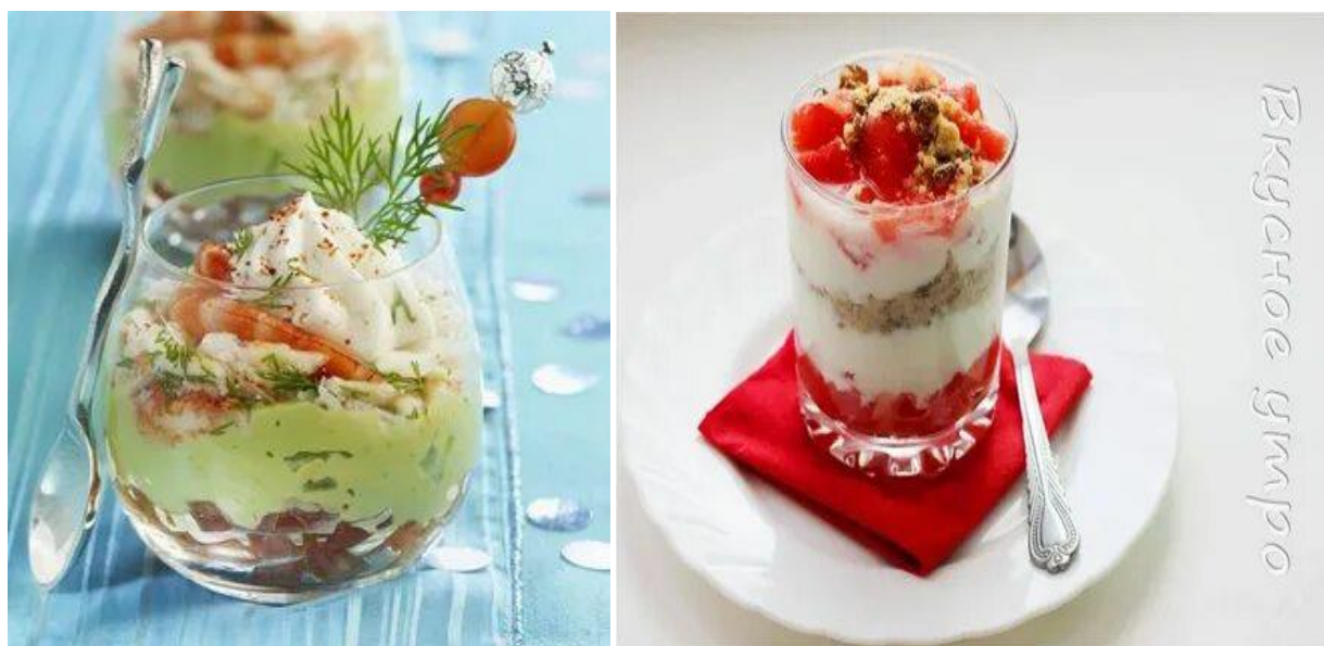
Веррины с тунцом и овощами

Веррины могут быть закусочными (солёными) и десертными (сладкими), но и в том, и в другом случае ингредиенты кладутся в бокалы слоями.