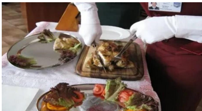
Английский метод: раскладывание блюда на подсобном столе.