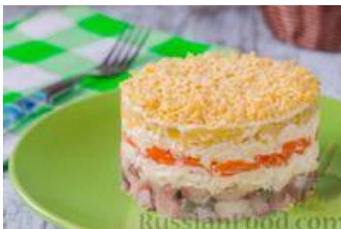
Салат из сельди с красным перцем «Украинский»