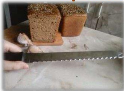
Нож для нарезки хлеба