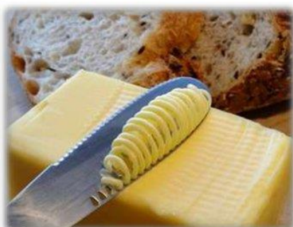
Нож для масла